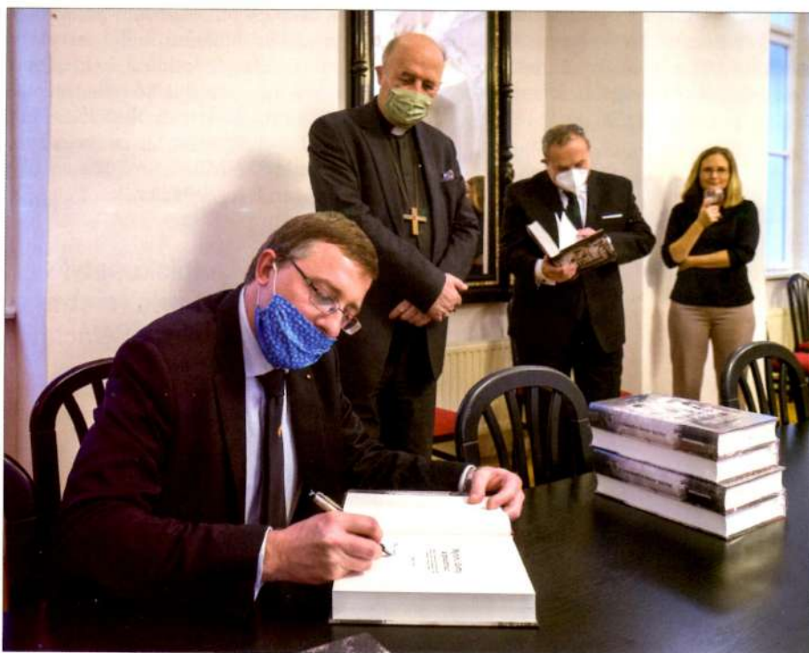
Autor publikace, v pozadí arcibiskup Jan Graubner, který knihu požehnal.

Je tomu skutečně tak. Svatý stolec kromě vlastních rytířských řádů, tedy významání rytířského typu udělovaných papežem, uznává pouze dva rytířské řády: Suverénní řád maltézských rytířů a Řád Božího hrobu. Oba mají zvláštní postavení: Maltézský řád je suverénní, je subjektem mezinárodního práva, tedy je postaven na roveň státu, Řád Božího hrobu je sice samostatný, ale jeho statut schvaluje papež (naposledy papež František v květnu 2020) a papež také jmenuje jeho velmistra z řad členů kardinálského sboru. Je také považován za součást institucí,